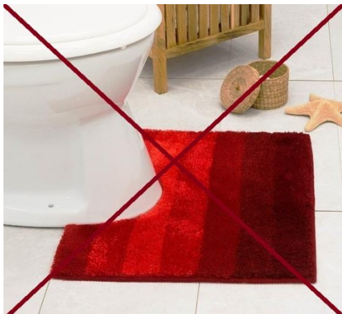
Geen losse matjes