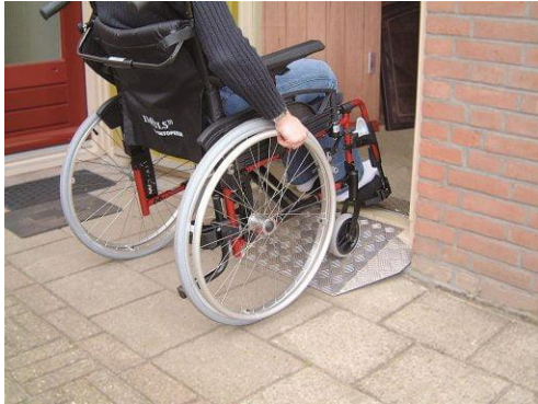
Brede deur en drempelhulp