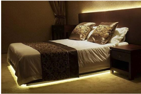
Bedverlichting met sensor

Gemak en veiligheid gaan samen in bijvoorbeeld: